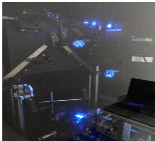
شکل ۳: تصویری از چیدمان تداخل دوباریکه ای در هنگام نوشتن توری براگ با لیزر آبی ۴۷۳ نانومتر

چیدمان بر روی یک صفحه اپتیکی و تا حد امکان جمع و جور بر روی یک میز اپتیکی و درون یک جعبه قرار داده شده است تا از تاثیر اعوجاجات هوای اطراف بر روی آینه‌ها و در نتیجه ارتعاش آنها جلوگیری کند. در شکل ۳ و ۴ تصویر این چیدمان و چیدمان تزویج فیبر به موجبر نشان داده شده است.