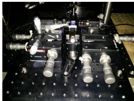
شکل ۴: تصویری از چیدمان تزویج نور چشمه گسیل خودبخودی تقویت شده هنگام نوشتن توری براگ توسط نور لیزر آبی ۴۷۳ نانومتر