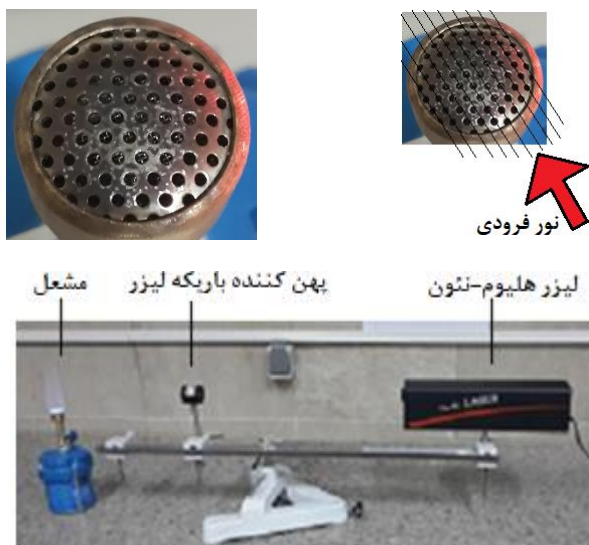
شکل ۱: (بالا) عکسی از سر مشعل که دارای منافذ متعدد است. (پایین) عکسی از چیدمان آزمایش برای بررسی انتشار نور لیزر هلیوم-نئون از یک دسته شعله گاز بوتان-پروپان.

برای بررسی انتشار نور در فضایی که شامل یک دسته شعله باشد از مشعلی که دارای سوراخ های متعدد است استفاده می شود. در شکل ۱-بالا تصویری از آن آورده شده است. وقتی که مخزن گاز به این مشعل وصل شود و روشن گردد از هر منفذ آن یک ستون گازی مشتعل تولید می گردد. جهت تاباندن نور به این شعله ها از چیدمانی که در شکل ۱ نشان داده شده است استفاده می شود.