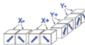
شکل ۲: رابطه حوزه های مختلف در \text{BiFeO}_3//\text{(100) SrTiO}_3

دسته بندی شده است. با توجه به شکل (۲) برای جمع قطبش در راستاهای مختلف داریم: