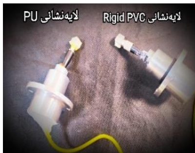
شکل ۲: حسگرهای تار نوری فابری-پرو آماده شده برای قرارگیری در محفظه خلاء

در محفظه خلاء باید آماده شود. برای این کار قطعه آلومینومی تو خالی هم اندازه با محفظه خلاء توسط دستگاه‌های تراشکاری درست کرده و حسگر را درون محفظه قرار داده و درون آن را با رزین اپکسی پر می‌کنیم و یک روز صبر کرده تا آن به خوبی خشک شده و سپس درون محفظه خلاء قرار می‌دهیم تا ایجاد خلاء کند.