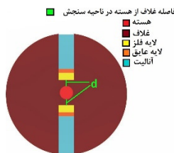
شکل ۱- شماتیک مقطع عرضی ساختار مورد نظر [۵].

در این بررسی، فیبر نوری H شکل با سطح مقطع عرضی مطابق شکل ۱ در نظر گرفته می‌شود. در شکل شماتیک، فاصله مشخص d در دوطرف، قسمت باقی‌مانده از غلاف در ناحیه سنجش است. ابعاد قطر هسته فیبر، قطر غلاف و پهنای لایه‌های روی فیبر به ترتیب، ۸/۲، ۶۰ و ۱۰ میکرومتر است. پهنای دو لایه فلز و عایق در طول شبیه‌سازی ثابت است [۳ و ۵].