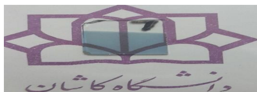
شکل ۲: نمونه‌ی ساخته شده الکتروود شفاف \text{MoO}_3/\text{Ag}/\text{MoO}_3

مشخصات فوتوولتائیک سلول‌های ساخته شده توسط دستگاه ولتاژ- جریان تحت تابش نور با توان ۱۰۰ میلی وات بر سانتی متر مربع اندازه‌گیری شد. منحنی چگالی جریان بر حسب ولتاژ این سلول‌ها در شکل ۳ نشان داده شده است.